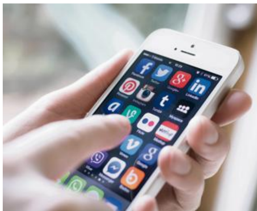
Le réseau LinkedIn est devenu l'un des moyens les plus exploités par les recruteurs. 64 % d'entre eux l'utilisaient quotidiennement et, en priorité, en 2016.

teur associé du cabinet AspenRH. D'ailleurs, d'après l'Association pour l'emploi des cadres (Apec), l'utilisation d'un ou plusieurs réseaux sociaux par les recruteurs a progressé de 2 points en 2016 pour atteindre 36 %, contre 34 % l'année précédente. Avec ces nouveaux usages, la valeur ajoutée des cabinets s'est transformée. Elle se traduit aujourd'hui par leur capacité à bien restituer le projet de leurs clients, et même à anticiper leurs besoins. « Il faut savoir dépasser LinkedIn en retournant à une fonction plus académique du chasseur de têtes », explique Gwenaëlle Garrigues, associée du cabinet Solutions and Performances. Les candidats sont, en effet, de plus en plus sollicités. Ils répondent donc moins à une telle approche directe. Les réseaux sociaux facilitent le sourcing des cabinets de recrutement, mais le contact humain reste la clef d'un recrutement réussi. ■